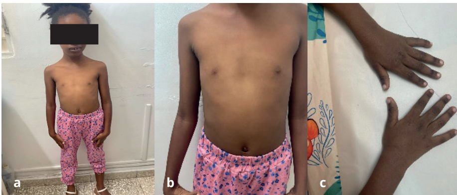
Figura 3. Crecimiento asimétrico con una estructura delgada

Nota. Figura 2a. Nótese la asimetría facial de predominio izquierdo. La niña muestra fisuras palpebrales inclinadas hacia abajo, pestañas largas y una nariz prominente con una punta ancha. Tiene micrognatia, un surco nasolabial corto y mala oclusión dentaria. Figuras 2b. 2c. 2d. Forma y posición irregular de los dientes, apiñamiento dental, hiperplasia de las encías, paladar alto y estrecho.